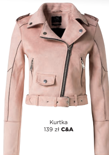
Kurtka 139 zł C&A