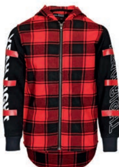
Koszula 109,99 zł Reporter Young