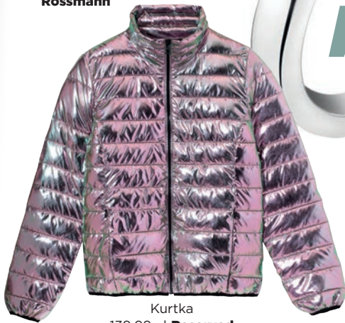
Kurtka 139,99 zł Reserved

ABY NIE BYŁO NUDNO, PASTELE PRZEŁAM KONTRASTOWĄ BARWĄ LUB POŁĄCZ Z POŁYSKIEM.