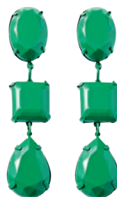
Kolczyki 39,99 zł Reserved