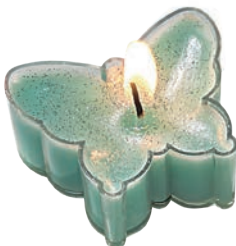
Świeczka/3 szt. 4 zł Kik