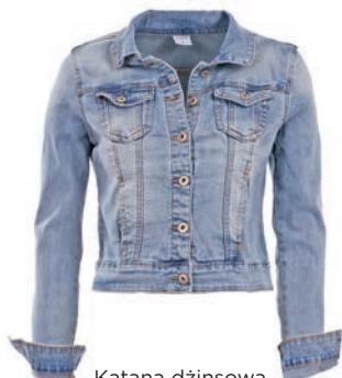
Katana dżinsowa 79,99 zł Szachownica