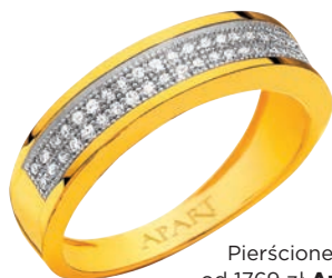
Pierścionek od 1769 zł Apart