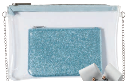
Kosmetyczka 59,90 zł C&A