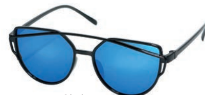
Okulary 14,99 zł Sinsay