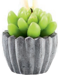
Świeczka 7,99 zł Kik