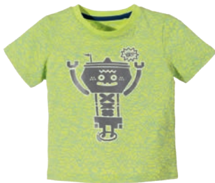
T-shirt 39,99 zł 5.10.15.