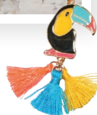
Naszyjnik 12,99 zł Sinsay