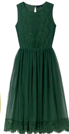
Sukienka 179,99 zł Reserved