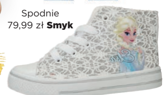
Buty 49,99 zł CCC