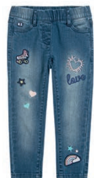
Spodnie 79,99 zł Smyk