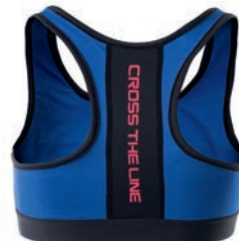
Top sportowy 89,99 zł Martes Sport