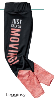
Legginsy 14,99 zł Kik