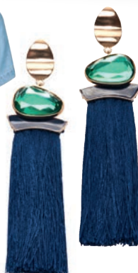
Kolczyki 29,99 zł Mohito