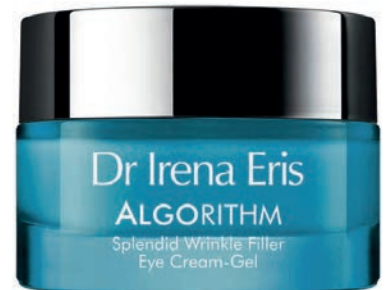
Krem Dr Irena Eris 109 zł Sephora