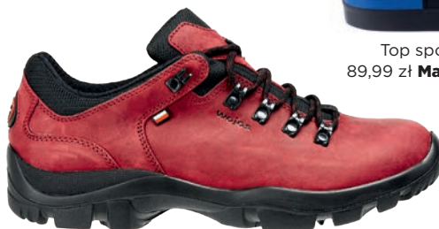
Buty 349 zł Wojas