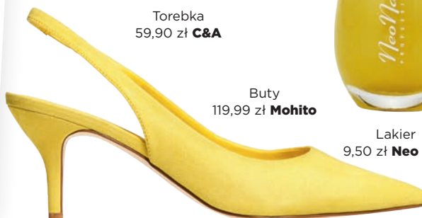
Buty 119,99 zł Mohito