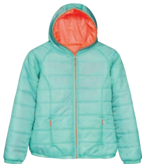
Kurtka 89,99 zł Cropp