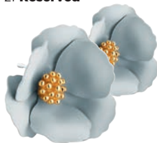
Kolczyki 59 zł Apart