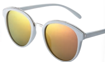
Okulary 19,90 zł C&A