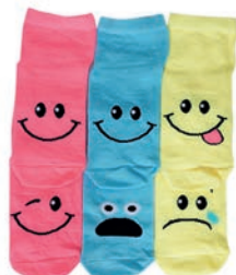
Skarpetki 21,99 zł Reporter Young