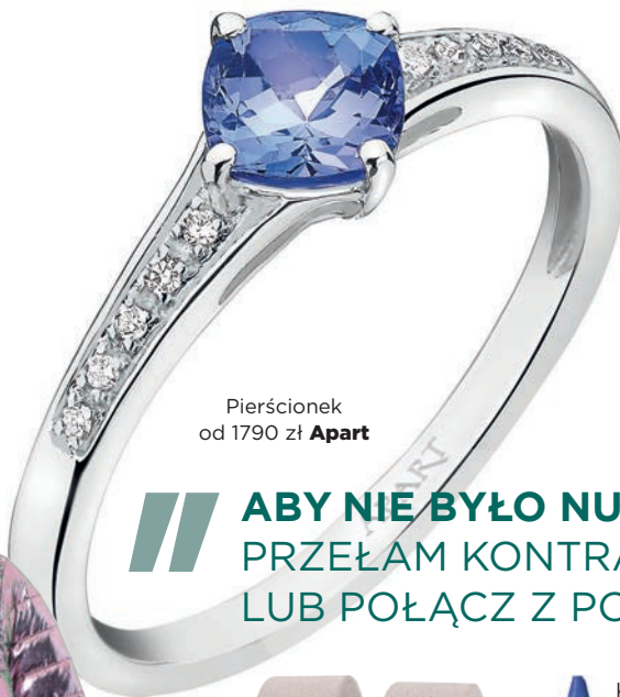
Pierścionek od 1790 zł Apart