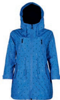
Kurtka 299,99 zł Carry