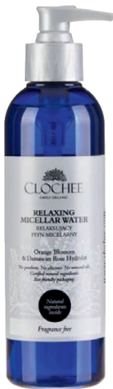
Płyn micelarny Clochee 62 zł Astor