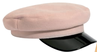
Czapka 49,99 zł Reserved