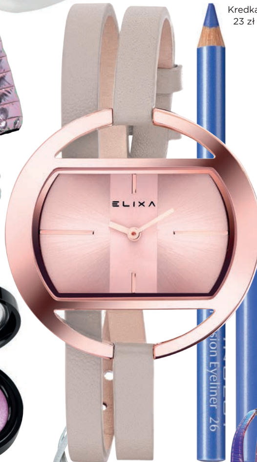
Zegarek 530 zł Apart