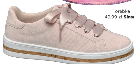
Sneakersy 99,90 zł Deichmann