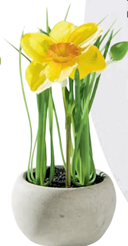
Sztuczne kwiaty 6,99 zł Kik