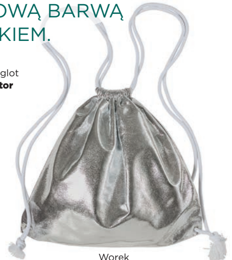
Worek 49,90 zł C&A