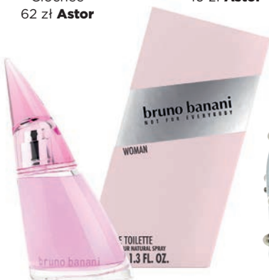
Perfumy bruno banani 40 ml 69,99 zł Astor