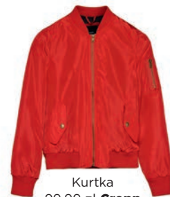
Kurtka 99,99 zł Cropp