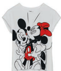
T-shirt 59,99 zł Cropp