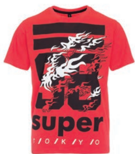
T-shirt 39,99 zł Reporter Young