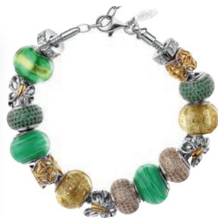
Bransoletka Beats zestaw od 1638 zł Apart