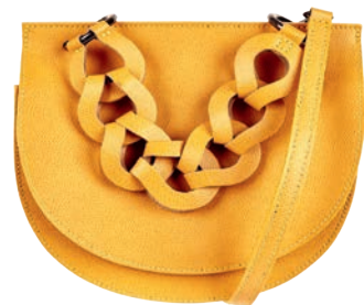
Torebka 349 zł Wojas