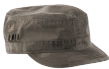
Czapka 49,90 zł C&A