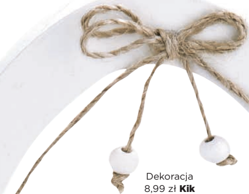
Dekoracja 8,99 zł Kik

Spraw sobie przyjemność i postaw na dodatki w kolorach wiosny. Kilka drobiaźgów nie tylko odświeży twoją garderobę, ale i poprawi nastrój. Przywołaj wiosnę także do swojego mieszkania. Słoneczne i nasycone kolory są w tym sezonie niezastąpione.