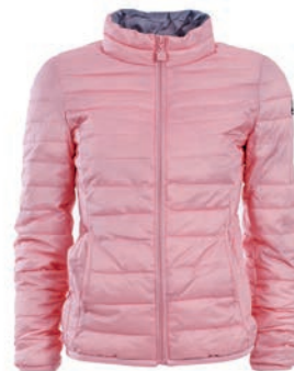
Kurtka 99,99 zł Szachownica