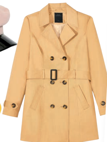
Trencz 169,99 zł House