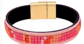
Bransoletka 74 zł Aweg