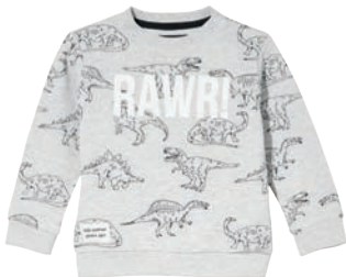
Bluza 49,99 zł Reserved