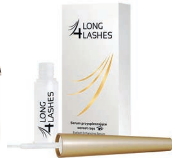
Odżywka do rzęs Long 4 Lashes 49,99 zł Astor

ABY NIE BYŁO NUDNO, PASTELE PRZEŁAM KONTRASTOWĄ BARWĄ LUB POŁĄCZ Z POŁYSKIEM.