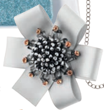
Broszka 89 zł Apart