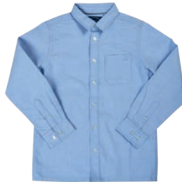
Koszula 49,99 zł Smyk