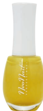
Lakier 9,50 zł Neo Nail