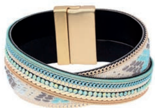
Bransoletka 84 zł Aweg

PASTELE NIE WYCHODZĄ Z MODY. JASNY RÓŻ I SŁODKI BŁĘKIT SPRAWDZĄ SIĘ ZARÓWNO W CIĄGU DNIA, JAK I NA WIECZÓR.