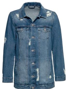
Kurtka 149,99 zł Takko Fashion