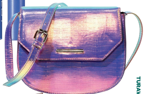
Torebka 49,99 zł Sinsay