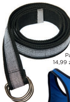
Pasek 14,99 zł Sinsay