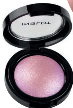
Rozświetlacz Inglot 49 zł Astor