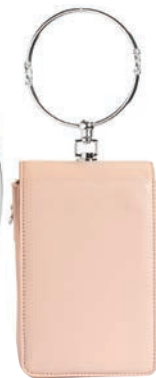
Torebka 99,99 zł Reserved