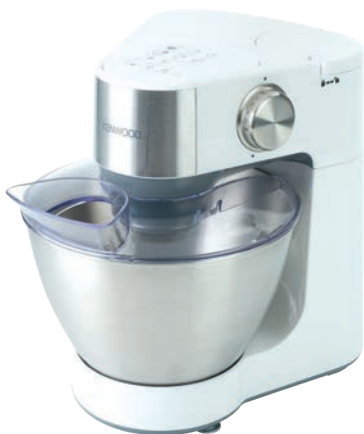
Robot Kenwood 699,99 zł Media Expert