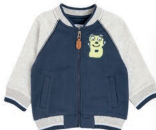
Bluza 49,99 zł Smyk