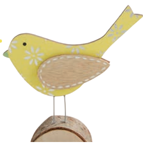
Dekoracja 7,99 zł Kik