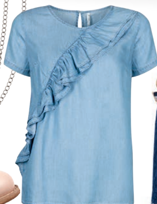
Bluzka 99,99 zł Carry