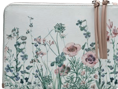
Torebka 59,90 zł C&A