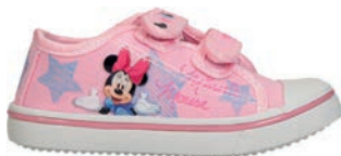
Buty 39,99 zł CCC