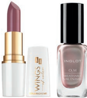
Pomadka AA Wings 26,99 zł Rossmann