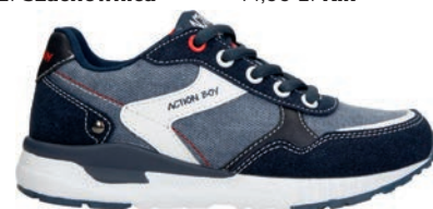
Buty 89,99 zł CCC