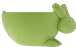
Pojemnik na rzeżuchę 21,99 zł Rossmann