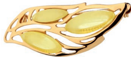
Broszka 199 zł Apart

PASTELE NIE WYCHODZĄ Z MODY. JASNY RÓŻ I SŁODKI BŁĘKIT SPRAWDZĄ SIĘ ZARÓWNO W CIĄGU DNIA, JAK I NA WIECZÓR.