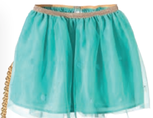
Spódniczka 89,99 zł 5.10.15.