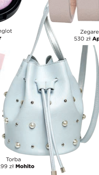
Torba 89,99 zł Mohito