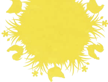
Podkładka 8,49 zł Rossmann