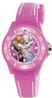
Zegarek 170 zł Apart

NAJWAŻNIEJSZA JEST SWOBODA! NIECH NIC NIE PRZESKODZI W PRZEŻYWANIU KOLEJNYCH PRZYGÓD.