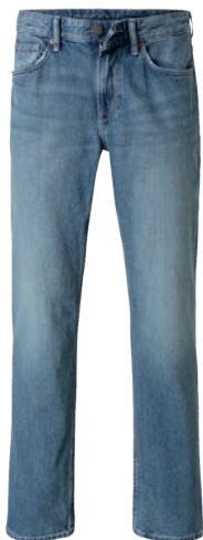
Spodnie 79,90 zł C&A