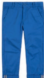
Spodenki 49,99 zł Smyk