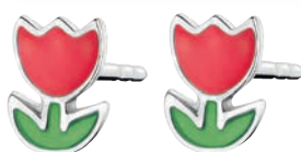
Kolczyki 64 zł Apart